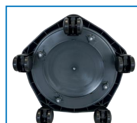
5 roți pentru stabilitate și manevrabilitate ușoară