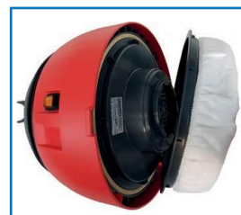
Carcasă motor cu coș filtru complet